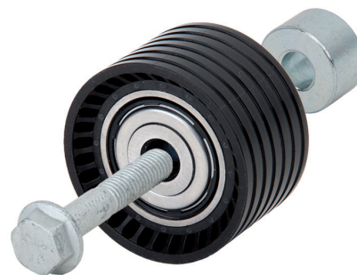
Bild 2: 55633 – Umlenkrolle mit neuem Dichtungskonzept und Anbauteilen

Daraus ergeben sich folgende Änderungen: